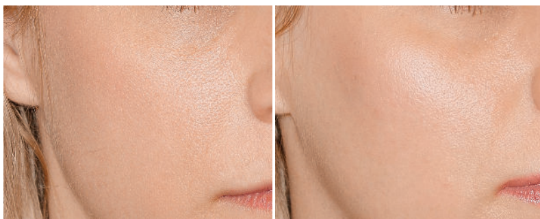
pies de foto

El ciclo completo de Restylane Vital® - Radiesse® - Restylane Vital®, es de 800 Euros.